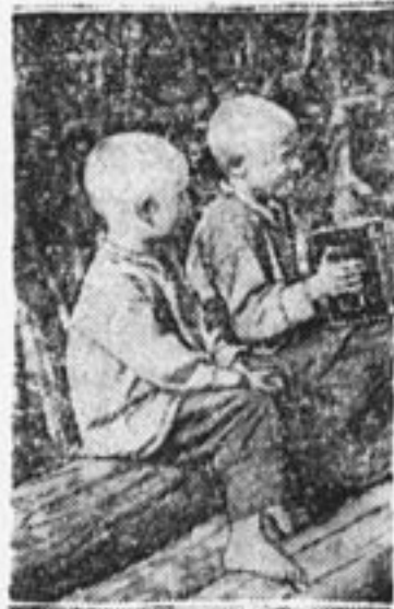
Юный деревенский гармонист.

в общественном изживении, то есть они живут за счет общих средств, а более старшие уже зарабатывают сами. Мы стараемся давать им самую легкую работу. Ее распределяет совет коммуны. Было бы неплохо, если бы в распределении работы, которая предназначена для ребят, принимал участие представитель пионерского отряда.