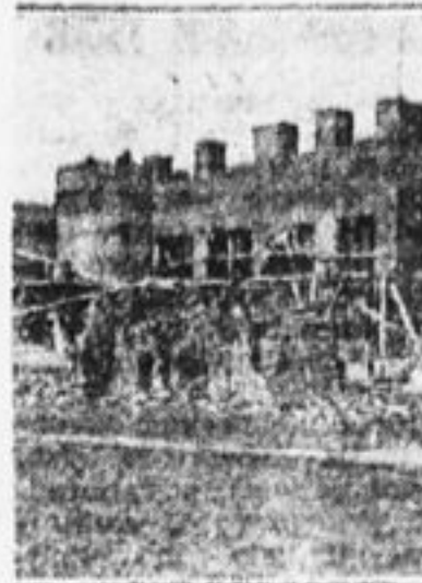
Постройка здания для детских игр в селе Ивантьевка, Пушкин. вол.