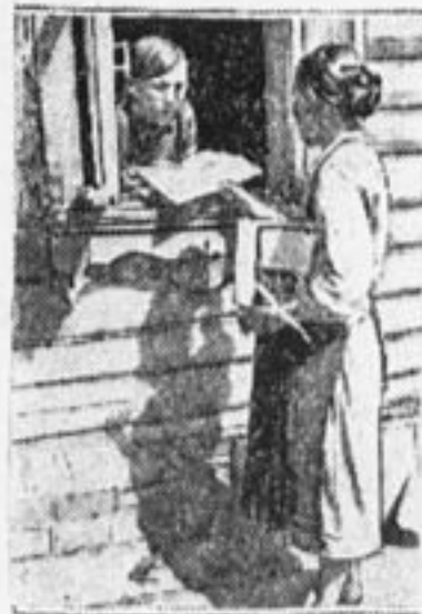
Доставка газет в деревне.

Пионеры состоят в отряде при школе. У нас в артели насчитывается 10—12 пионеров. Но, к сожалению, приходится отметить, что с их стороны не видно конкретных дел, которые помогали бы укреплению артели. Они больше заняты у себя внутри отряда и об их жизни никто из взрослых не знает.