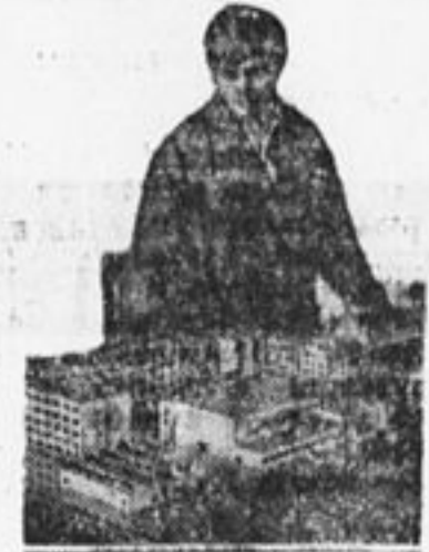
Макет строящегося в Москве Всесоюзного электротехнического института.