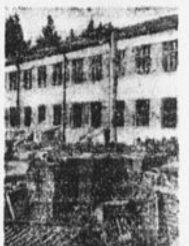
В селе Ивантьевке, Пушкинской волости, заканчивается постройка больницы.

— Я пионерка и в церковь не хожу. А отцу обязательно скажу, чтобы он в день индустриализации сам работал и товарищей своих позвал, коллективно-то ведь больше сделают. Заработок этого дня пусть отдадут на постройку новых фабрик и заводов, где может быть и нам придется впоследствии работать.